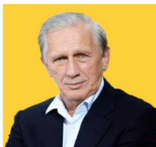
Jan Englert Dyrektor Artystyczny Teatru Narodowego