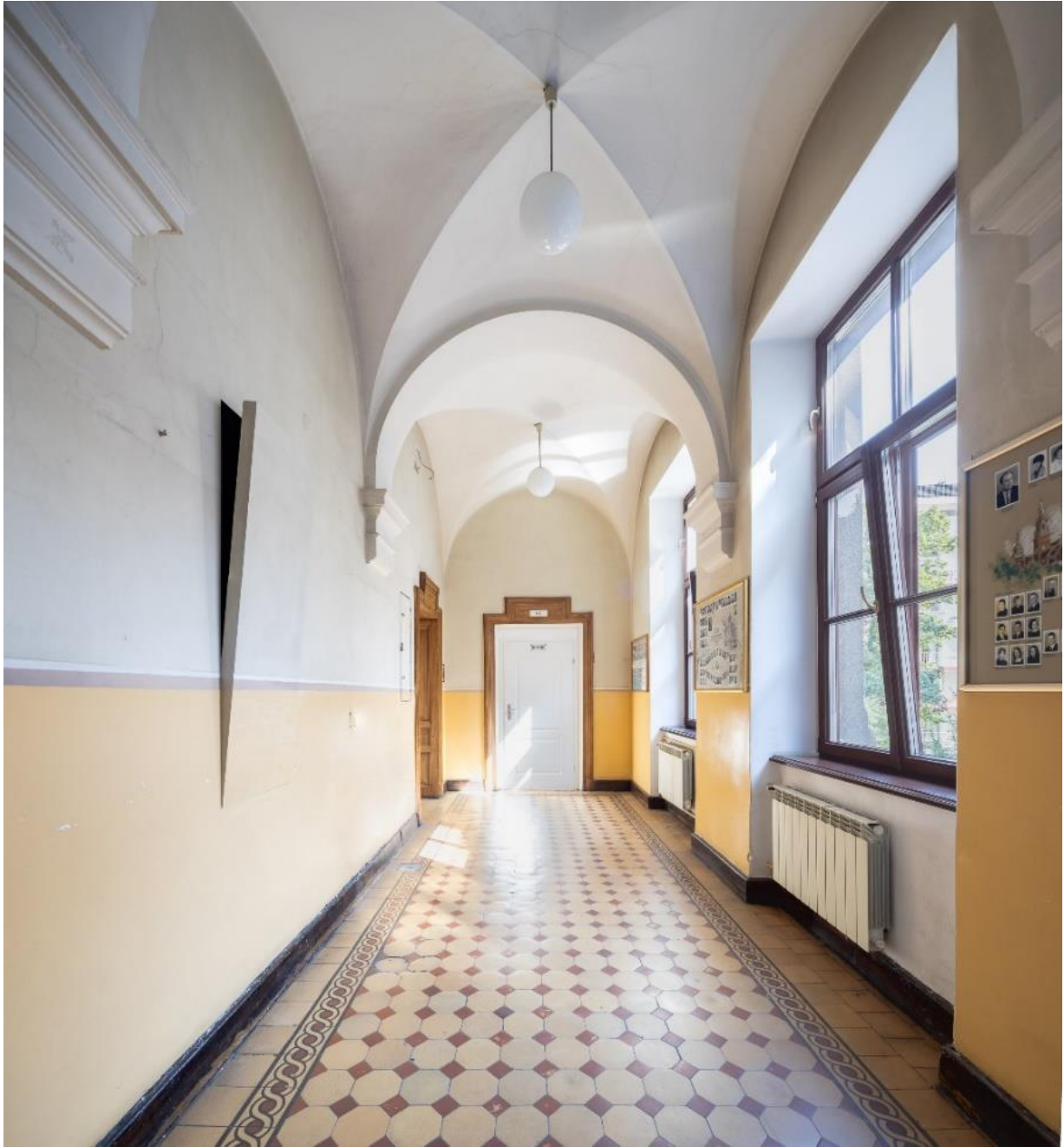
Wojciech Bąkowski, „Okno na wrzesień”, drewno, akryl, głośnik